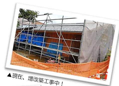
▲現在、増改築工事中！